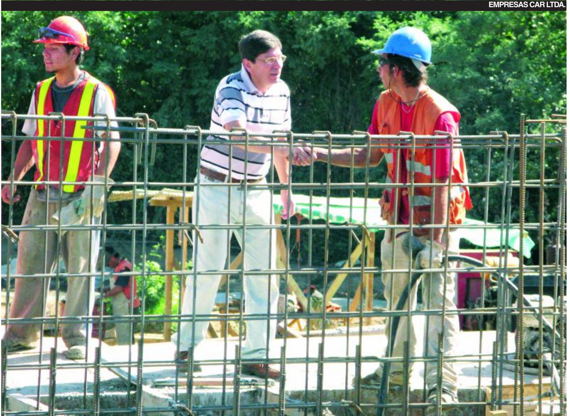
Ignacio Marín, gobernador de Ñuble