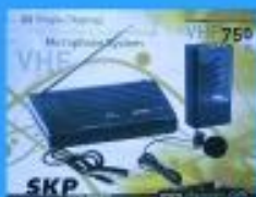
Mic. Inalámbrico $ 29.900