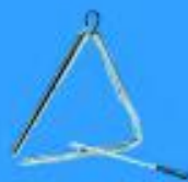
Triangulo $ 1.790