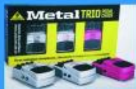
Pedales desde: $ 19.900