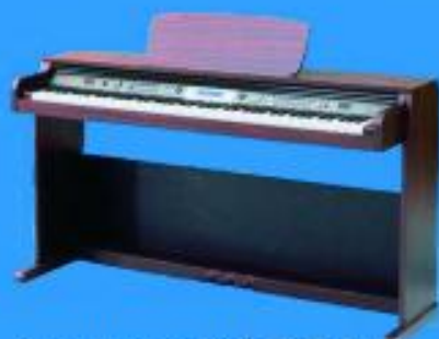
Piano Medelli 268 $ 369.900