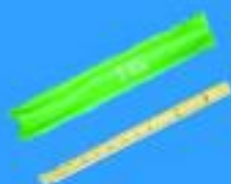
Flauta Honner $ 4900