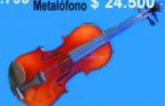
Violin 3/4 $ 39.900