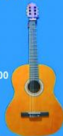
Guit. C/Funda $ 26.500