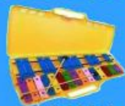
Metalófono $ 24.500