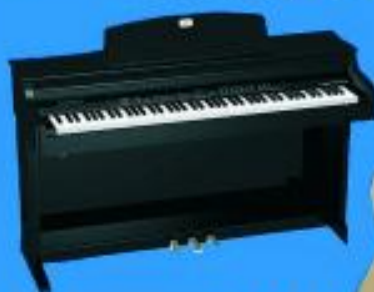
Piano Behringer 2080 $ 459.900