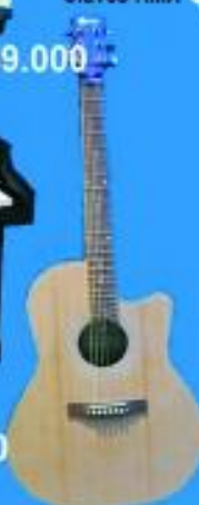
E/A Azalea $49.900