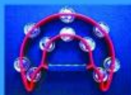
Panderero RMX $ 4900