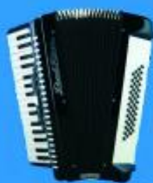
Acordeón 48B $ 269.000